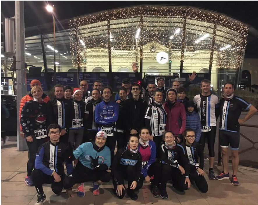
LE SU AGEN TRIATHLON A TACA N