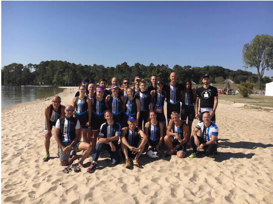
LE SU AGEN TRIATHLON A CASTELJALOUX 1