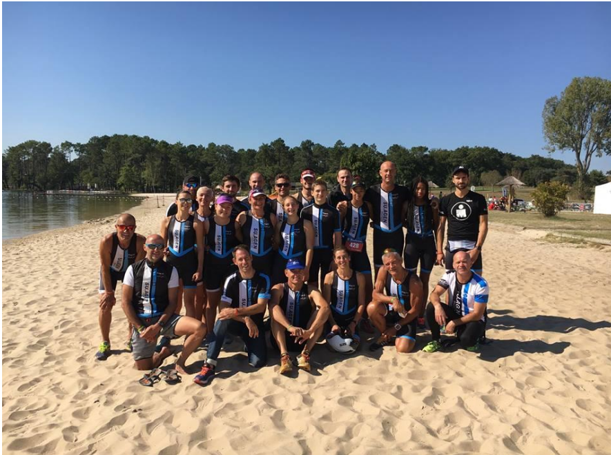
LE SU AGEN TRIATHLON A CASTELJALOUX 1